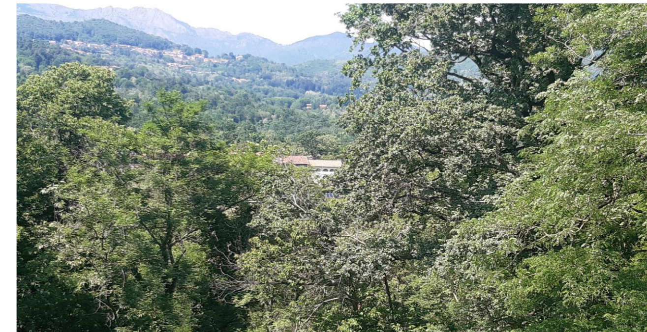
PUNTO A. VISTA PANORAMICA VERSO NORD

Dalla viste si evidenzia come non ci sia percezione visiva di nessuno dei contesti di nuovo intervento B4.1, B4.2, B3.1, B3.2