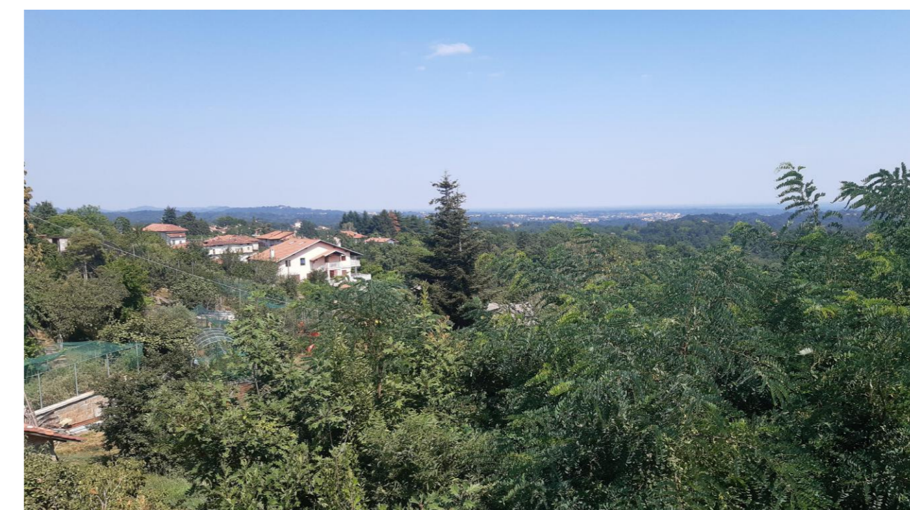
PUNTO B. VISTA PANORAMICA VERSO SUD EST

Il territorio del Comune di Ternengo non è visibile da nessuno dei belvedere individuati dal PPR entro cinque chilometri (elaborazione dott. Siletto - Regione Piemonte). Sul territorio comunale non erano individuati belvedere ma, sulla base degli approfondimenti fatti a seguito dei contributi pervenuti, vengono inseriti due punti panoramici: A. entro area a verde pubblico nei pressi della Chiesa Parrocchiale, contigua a un parcheggio pubblico; B. entro area a verde pubblico all'imbocco di Frazione Serracuta, contigua a un parcheggio pubblico.